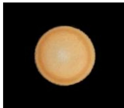
光纤输出光斑轮廓

脱毛、可控融脂 中深层提升、浅层提升 祛皱、焕亮肤色 血管病变、色素病变 光老化损伤